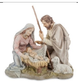
Б) Рождество Христово